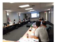
写真4 AMPPCDC と ISO 会議風景