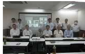
写真2 令和5年度総会風景