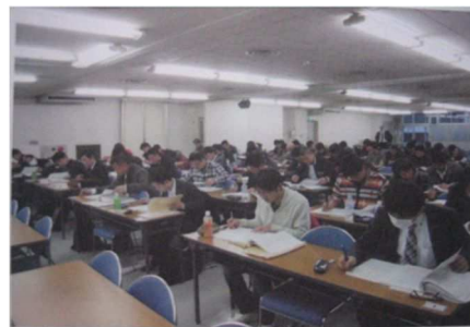
写真 1 コーティング管理技術者講習風景

当工業会は、(公社)日本プラントメンテナンス協会殿と連携して、防食耐久性点検に力を入れています。一方、顧客各位からの防食工事を会員に紹介し、その際エンジニアリングについてできるだけ協力し、その体制を確立していきたいと考えます。