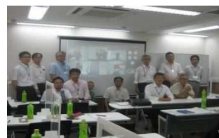
写真2 令和4年度総会風景