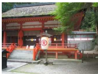
近隣の金毘羅さん白峰院 (1000段)